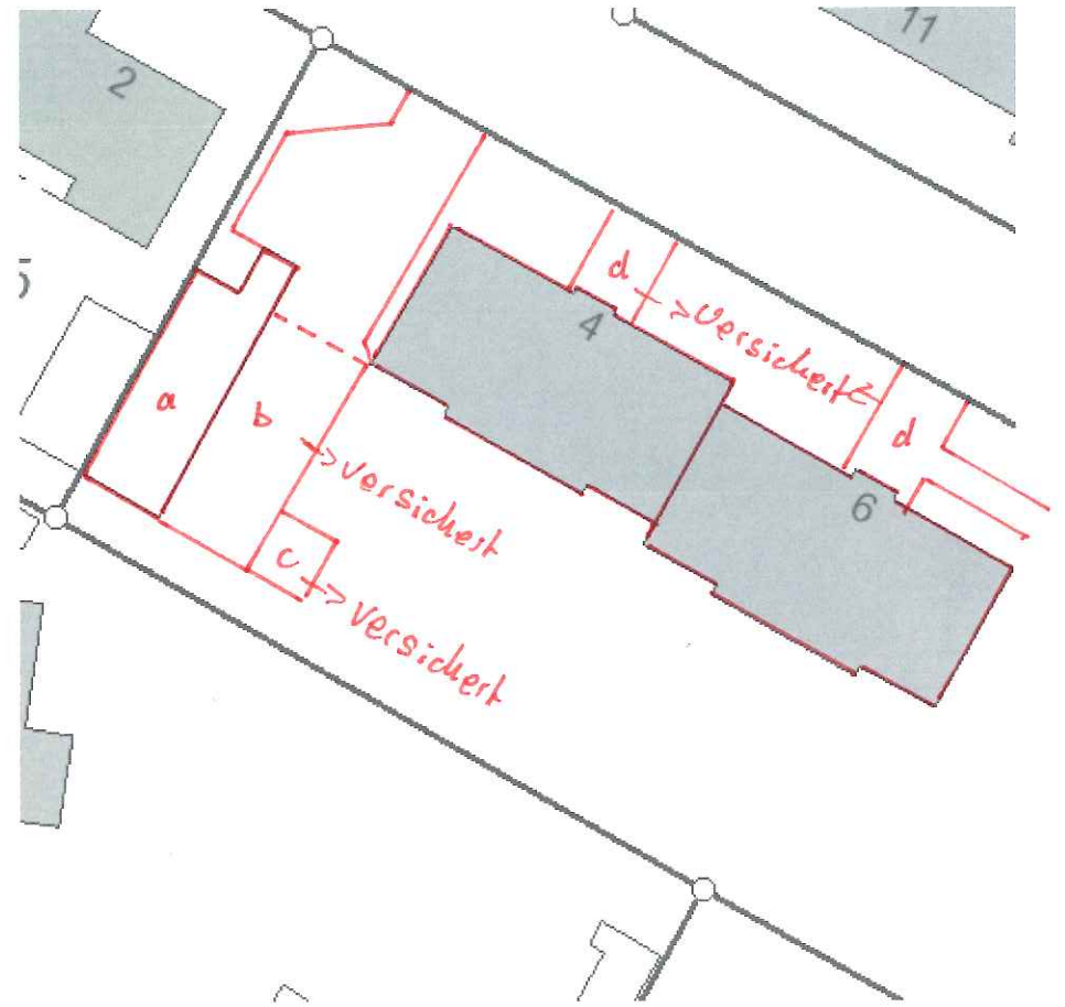
Musterstraße 4 und 6

Bitte markieren Sie die Flächen mit Angabe der Quadratmeter rechts im Lageplan, von denen kein Niederschlagswasser in die öffentliche Kanalisation abgeleitet wird.